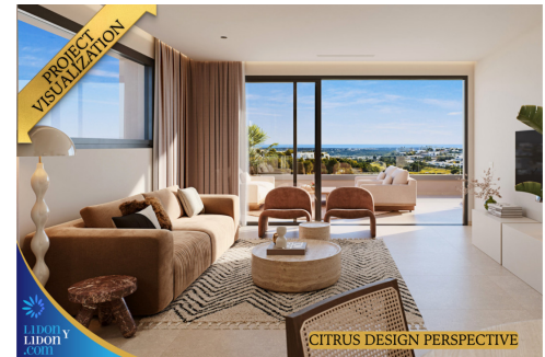
CITRUS DESIGN PERSPECTIVE