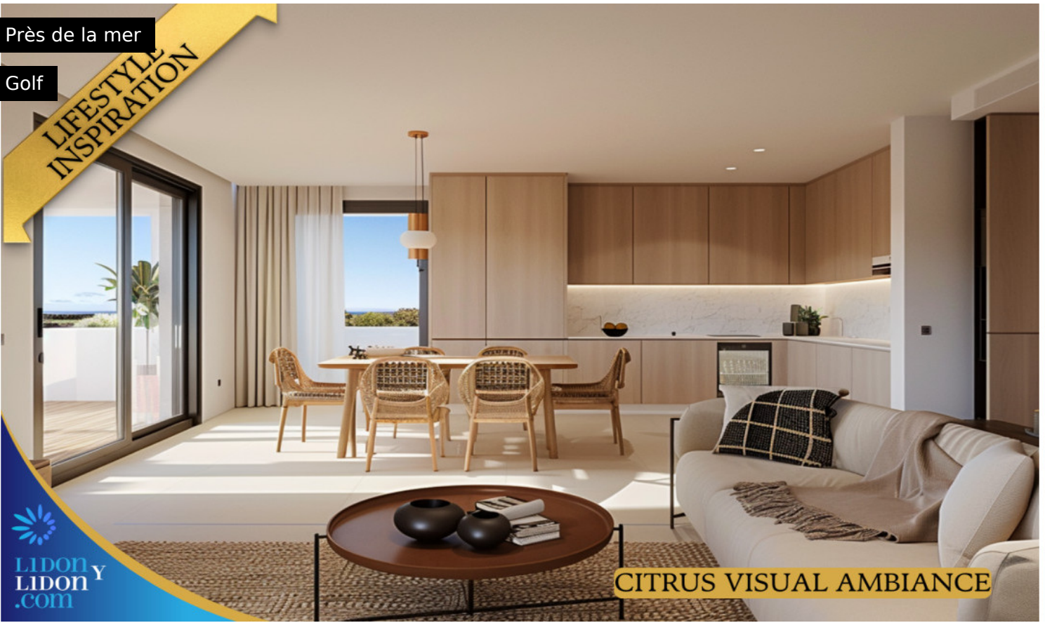
CITRUS VISUAL AMBIANCE