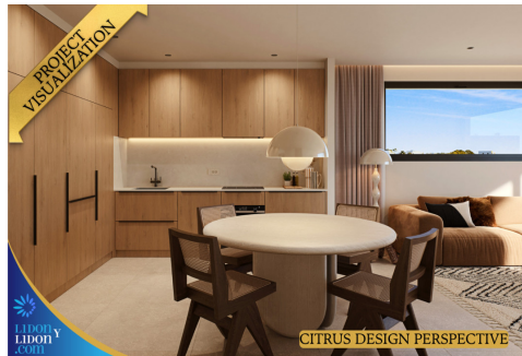
CITRUS DESIGN PERSPECTIVE