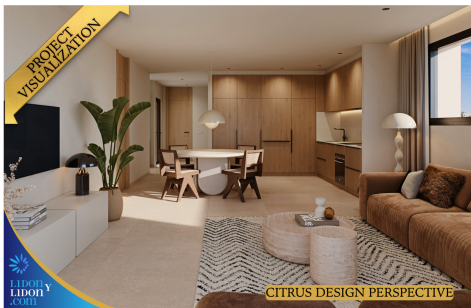
CITRUS DESIGN PERSPECTIVE